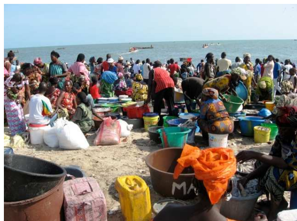
En attente des débarquements à Joal, Photo Lamine Niasse

Des conflits de toutes sortes sont apparus dans le secteur artisan : utilisation de certaines techniques de pêche prohibées dans quelques localités (filets dérivants à Yoff, l'utilisation de pots appâtés avec des déchets pourris pour la capture des poulpes à Yoff, incursion de pêcheurs dans les zones protégées de Ngaparou, de Joal et des îles du Saloum), ce qui souvent occasionne des heurts 1 .